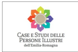
CASE E STUDI DELLE PERSONE ILLUSTRI dell'Emilia-Romagna