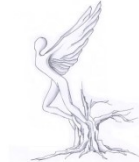
ISTITUTO COMPRENSIVO "Domenico Matteucci" Faenza Centro