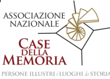
PERSONE ILLUSTRI / LUOGHI / STORIA