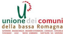
ALFONSEN - BAGANZANELLO - BAGNARA DI ROMAGNA - CONSOLETTI - CORIGNOLA FUSIGNARDO - LUZZO - MASSA SABBADARA - SANTI'AGATA SILE - SANVENERO