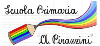
Scuola Primaria "A. Pirazzini"