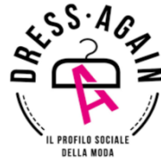
IL PROFILO SOCIALE DELLA MODA